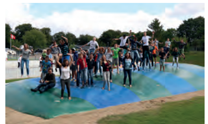
Gruppenbild von unserer Jugendfreizeit in Dänemark :-)