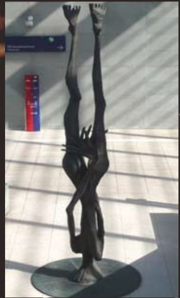
„Mahmal für Opfer religiöser Gewalt und gegen religiöse Intoleranz: Skulptur von Giordano Bruno am Potsdamer Platz in Berlin (Alexander Polzin, 2000)“